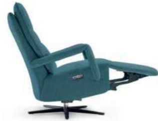
Posición TV con pies elevados. Position TV avec les pieds relevés. TV position with elevated legrest.