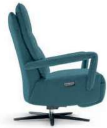
Cerrado. Fermé. Closed.