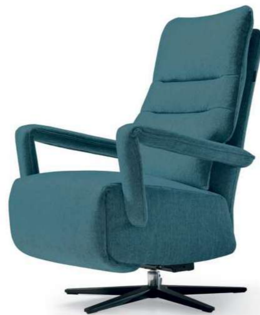
Tempo 16 Emerald (Vicotex)