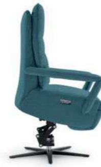
Elevado. Position Releveur. Stand up.