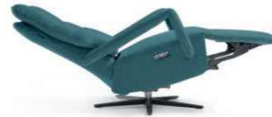
Reclinado máximo. Ouverture maximale. Maximum recline.