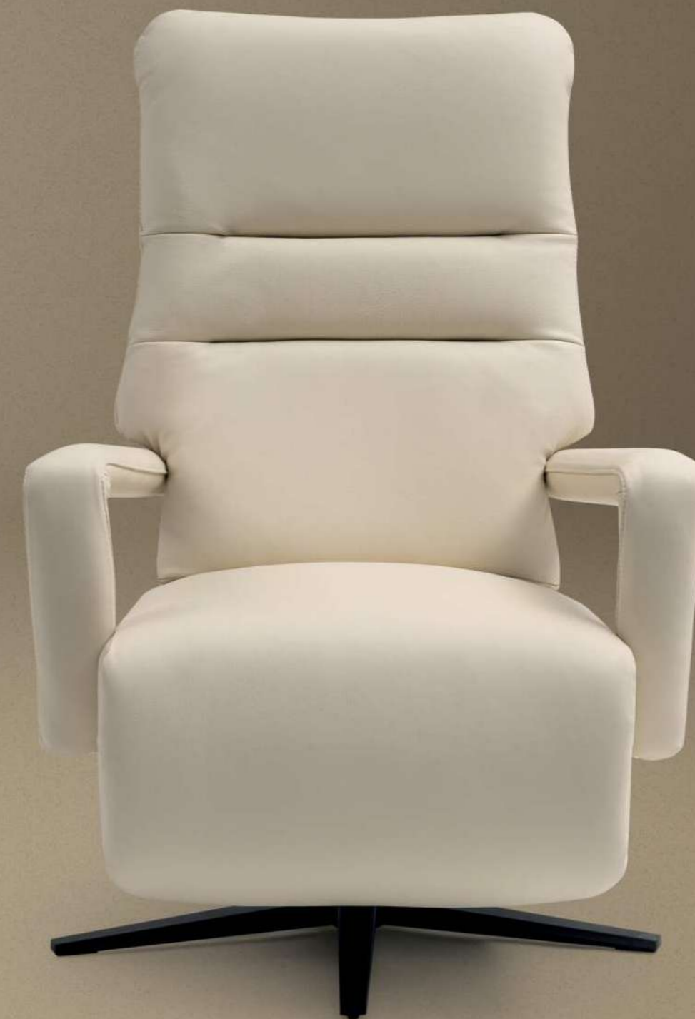
Sillones Relax - Fauteuils Relax - Recliner Armchairs